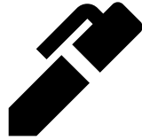
Чёрная гелевая ручка